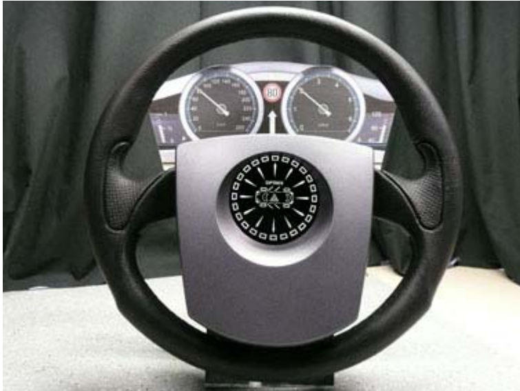
Studie eines Autolenkrads mit im Pralltopf integrierter kreisrunder OLED-Anzeige.